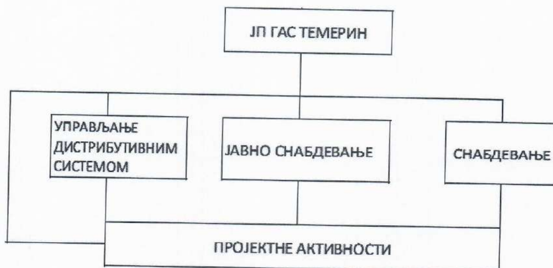
Сл 1. Шематски приказ делатности предузећа

Шематски изглед по делатностима је представљен на слици 1.